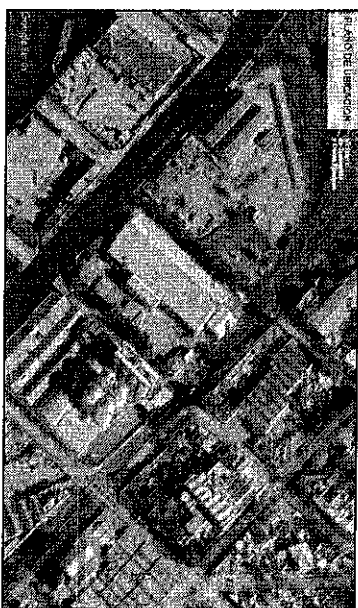
Planilla de Coordenadas de las Areas A y B